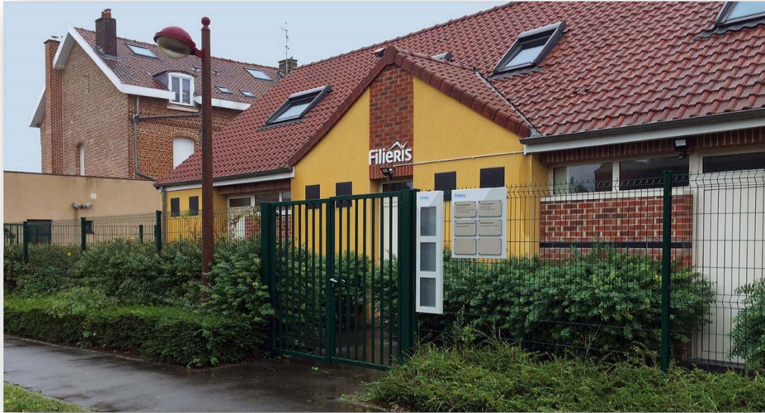
Centre de santé de Courcelles-lès-Lens ouvert le 4 novembre 2020