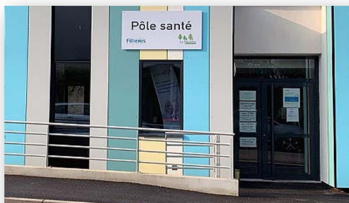
Centre de santé partagé à La Machine (Nièvre)