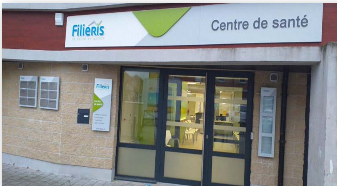
Centre de santé de Bruay-sur-l'Escaut ouvert le 16 décembre 2020

7,05 millions d'euros d'investissement en 2020